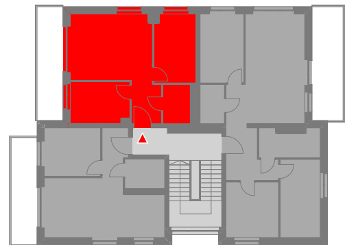
SCHEMATYCZNY RZUT 2 PIĘTRA