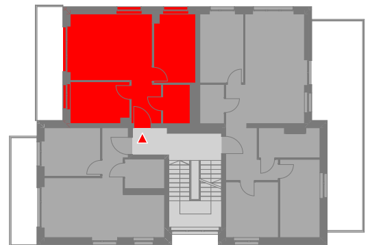
SCHEMATYCZNY RZUT 1 PIĘTRA