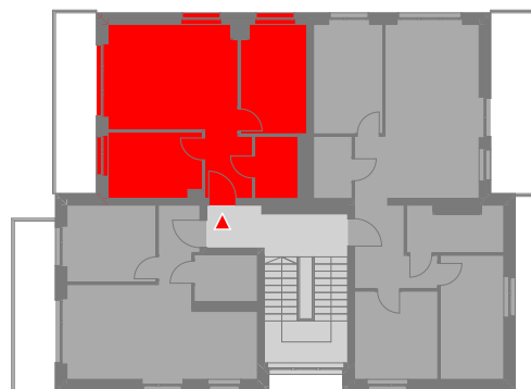
SCHEMATYCZNY RZUT 2 PIĘTRA