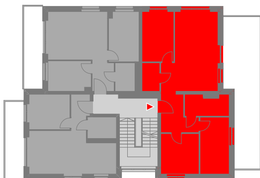
SCHEMATYCZNY RZUT 1 PIĘTRA