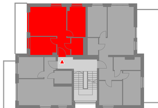
SCHEMATYCZNY RZUT 1 PIĘTRA