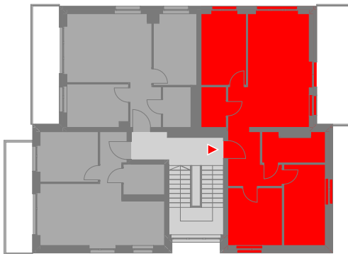
SCHEMATYCZNY RZUT 2 PIĘTRA