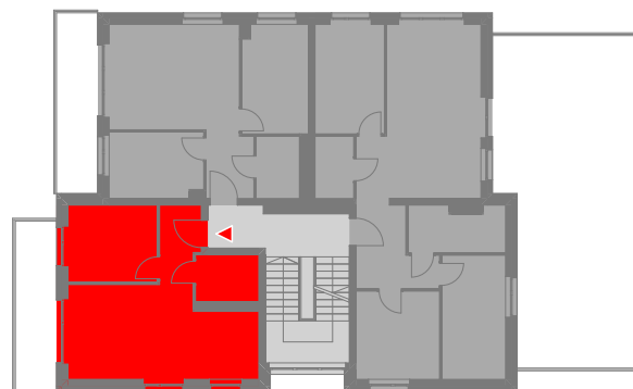
SCHEMATYCZNY RZUT 1 PIĘTRA